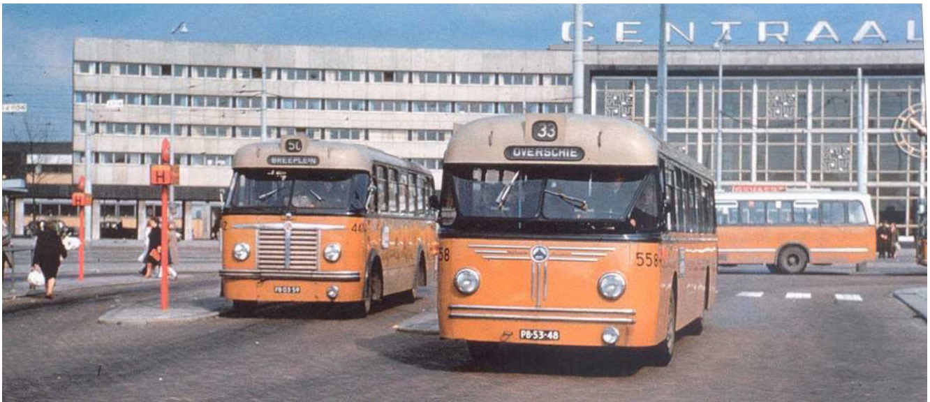
Lijn 33 gefotografeerd bij CS 1968