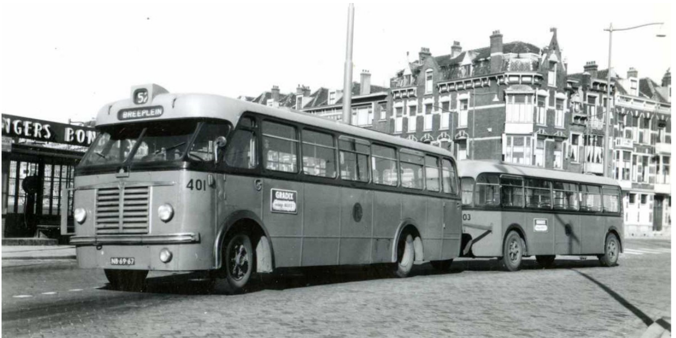
Lijn 52 bij eindhalte achterzijde CS

met vlag en wimpel. Ik had nu mijn GROOT rijbewijs met alle categorieën, A tot en met E. Vroeger was dat normaal. Tegenwoordig moet je voor ieder onderdeel apart theorie afleggen en afrijden. Ik kreeg een houten klapper met daarin alle kaartjes die in gebruik waren op het hele gebied van de RET.