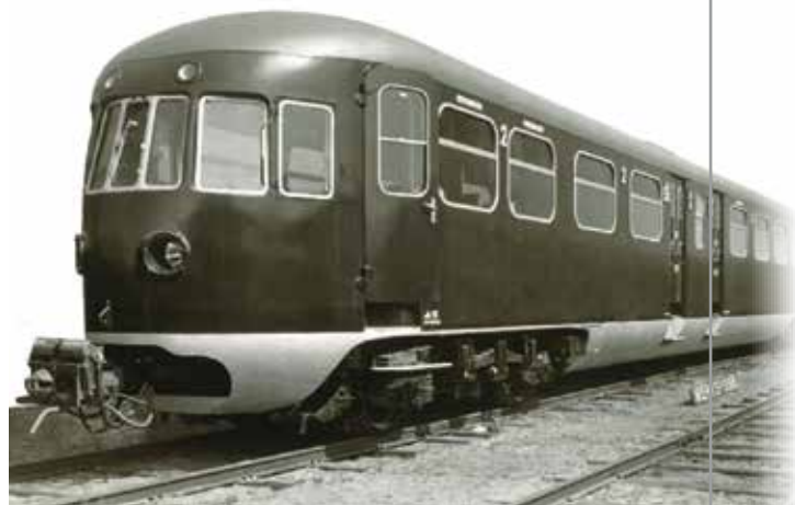
DE5 55 vastgelegd bij Werkspoor in Zuilen in 1940.

Uiteraard zal een presentexemplaar van het tijdschrift waarin het verhaal is opgenomen worden toegestuurd.