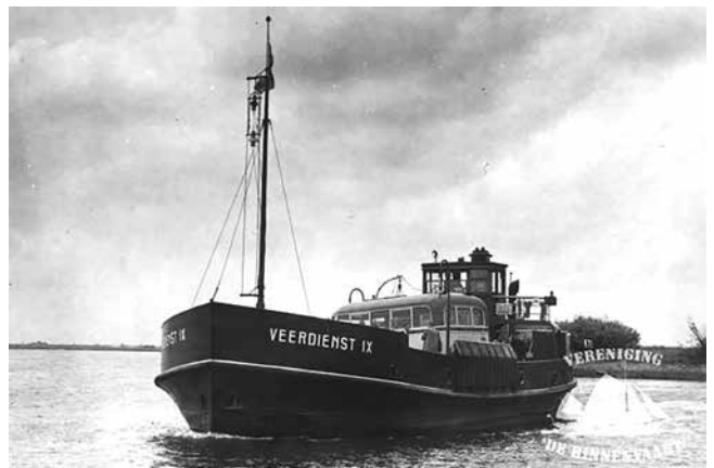
Veerdienst IX

Aan het einde van de oorlog waren er geen bussen over en kwamen de activiteiten stil te liggen. Na de oorlog werd er met man en macht gewerkt om weer enkele wagens aan het rijden te krijgen. In 1948, toen we 25 jaar bestonden, floreerde Edad bijna beter dan ooit. Inmiddels was de passagiersboot 'Thor' aangeschaft, waarmee een veerdienst werd onderhouden tussen s-Gravendeel, Wioldrecht en Zwijndrecht. Bij de watersnoodramp van 1953 heeft Edad een grote rol gespeeld bij de evacuatie van de mensen uit de verdrinken Hoeksche Waard.