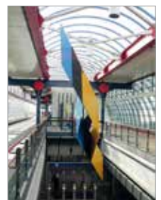
Foto voorblad: Amsterdam Sloterdijk Sculptuur Charles Marks (Bron Spoorbeeld)