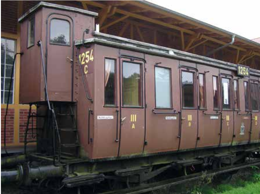
Remmershuisje op een passagierswagen

Een remmer was een personeelslid van een spoorwegonderneming die de zeer verantwoordelijke taak had de rem van een railvoertuig te bedienen op commando van de machinist (met een fluitsignaal)