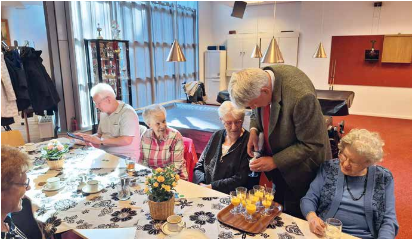
Advocaatje met slagroom.

Hallo allemaal, het papieren aprilnummer is weer bij u binnen maar ook veel leden krijgen een mailtje dat het digitale nummer in de inbox klaar staat om geopend te worden. Ik kreeg de waarschuwing van mijn echtgenote: "Moet nog niets wat schrijven voor het blaadje". Dat was drie maart, verdorie, opschieten dus. Hup de pc aanzetten en op het toetsenbord te werk gaan. Waar begin ik mee, nou eerst maar eens iets vermelden van de februari bijeenkomst. Het was een bedroevende opkomst, slecht